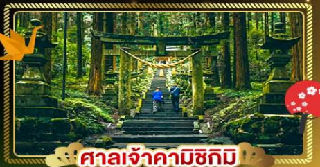
ศาลเจ้าคามิชิคุมิ