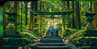
ศาลเจ้าคามิชิกิมี