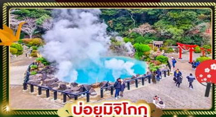
บ่อน้ำพุร้อน