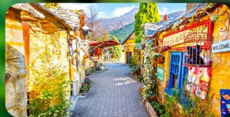
หมู่บ้านยูฟุอิน