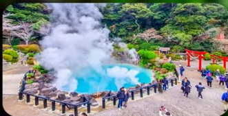
บ่อยูมิจิโกกุ

BEPPU AREA หรือเทียบเท่ามาตรฐานญี่ปุ่น 🏨 KUMAMOTO AREA หรือเทียบเท่ามาตรฐานญี่ปุ่น FUKUOKA AREA หรือเทียบเท่ามาตรฐานญี่ปุ่น