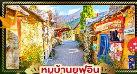
หมู่บ้านญี่ปุ่น