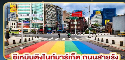
ซีเหมินติงไนท์มาร์เก็ต ถนนสายรุ้ง