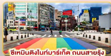
ซิเหมินตงไนท์มาร์เก็ต ถนนสายรุ้ง