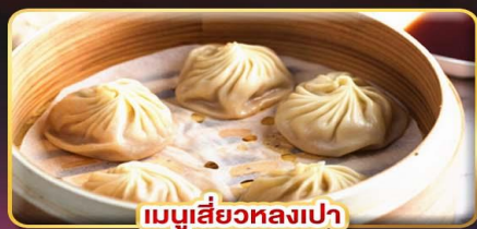
เมนูเสี่ยวหลงเปา