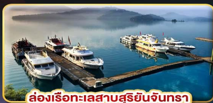
ล่องเรือทะเลสาบสุริยอันจินตรา