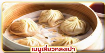
เมนูเสี่ยวหลงเปา