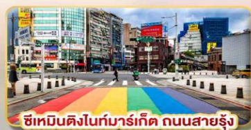
ซิเหมินตงไนท์มาร์เก็ต ถนนสายรุ้ง