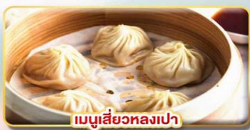
เมนูเสี่ยวหลงเปา