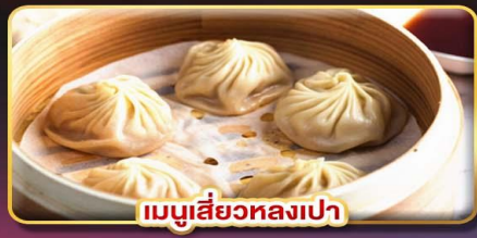
เมนูเสี่ยวหลงเปา