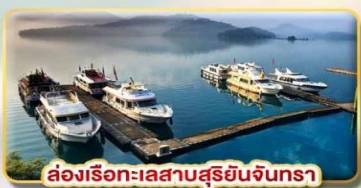
ล่องเรือทะเลสาบสุริยอันจินทรา