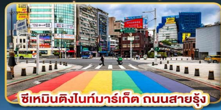
ซีเหมินติงไนท์มาร์เก็ต ถนนสายรุ้ง