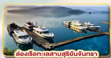
ล่องเรือทะเลสาบสุริยอันจินตรา