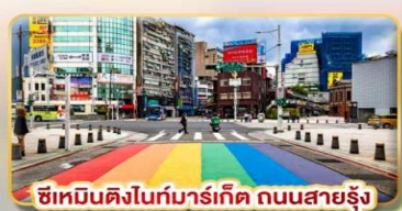
ซิเหมินตงไนท์มาร์เก็ต ถนนสายรุ้ง