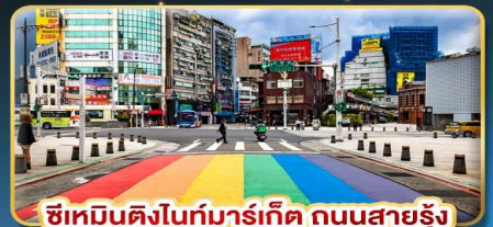
ซีเหมินติงไนท์มาร์เก็ต ถนนสายรุ้ง