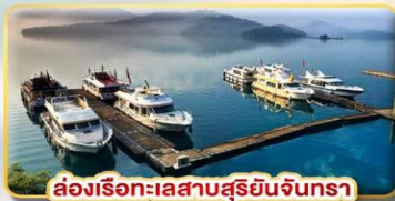
ล่องเรือทะเลสาบสุริยอันจินทรา