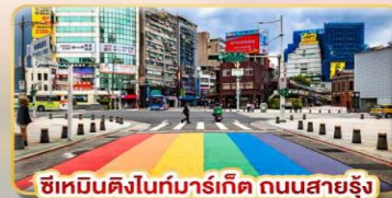
ซีเหมินติงไนท์มาร์เก็ต ถนนสายรุ้ง