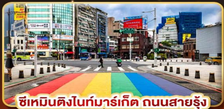
ซีเหมินดิงไนท์มาร์เก็ต ถนนสายรุ้ง