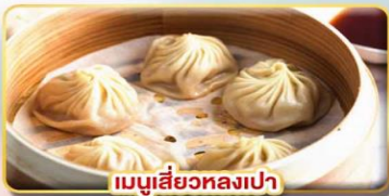
เมนูเสี่ยวหลงเปา