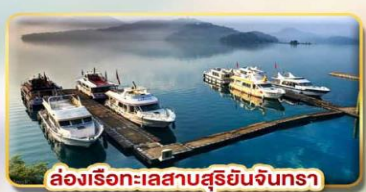
ล่องเรือทะเลสาบสุริยอันจินตรา