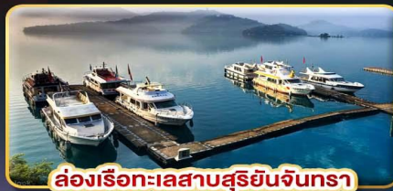
ล่องเรือทะเลสาบสุริยอันจินตรา