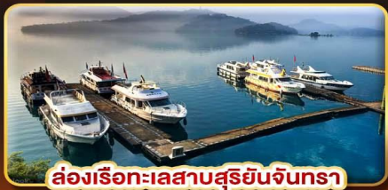
ล่องเรือทะเลสาบสุริยจีนกรรา