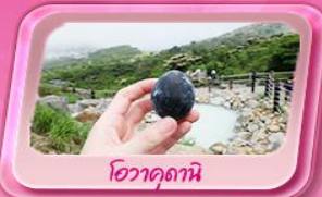
โอวาคุดานิ

พรมสีชมพูผืนใหญ่ที่ฐานฟูจิซัง! เทศกาลฮิบะซากุระ: 1 ปีมีครั้งเดียว เปิดประสบการณ์ส่องเรือโจรสลัด ตะลุยหุบเขาโอวาคุดานิ ซิมไข่ดำ "Unseen" ของพรมด้วยหัวโขนเท่า ที่วัดมิดสึจิมามา โชนเด็น ช้อปปิ้งจัดเต็มย่านดังชินจูกุ และ Gotemba Outlet