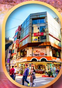
ช้อปปิ้งย่านเมียงดง