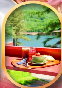
คาเฟ่ลับกลางป่า