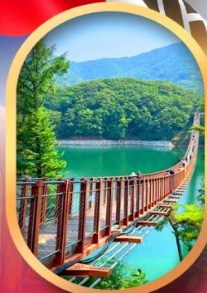
สะพานแขวนมาจิง