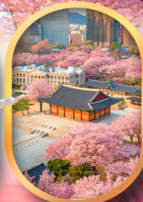
พระราชวังชางด็อกกุง