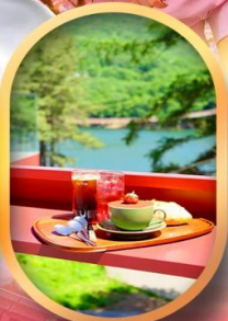
คาเฟ่ลับกลางป่า