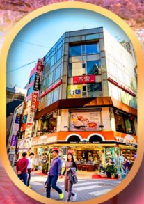
ช้อปปิ้งย่านเมียงดง