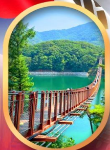
สะพานแขวนมาจิง