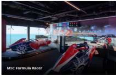
MSC Formula Racer