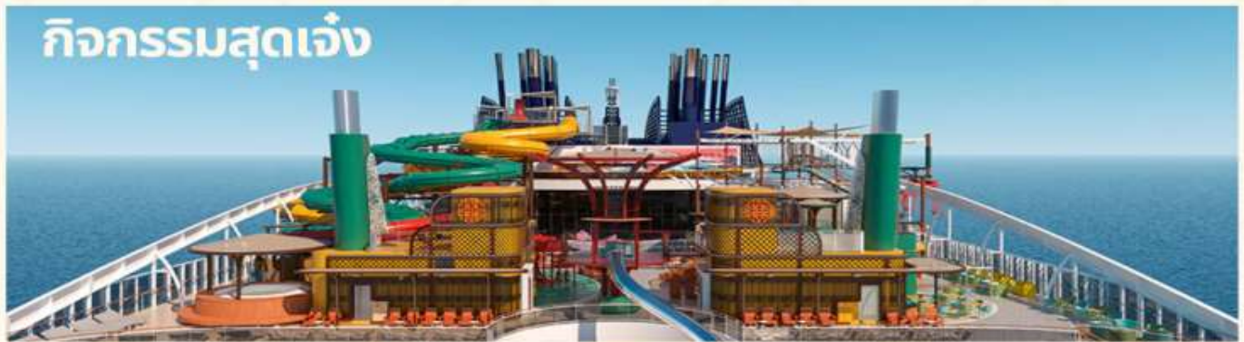
กิจกรรมสุดเจ๋ง