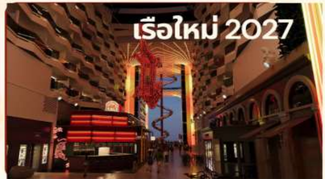
เรือใหม่ 2027