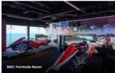
MSC Formula Racer