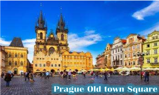
Prague Old town Square