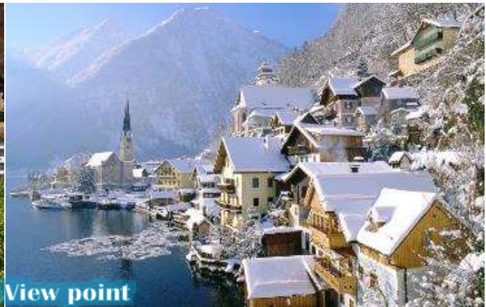
Hallstatt View point