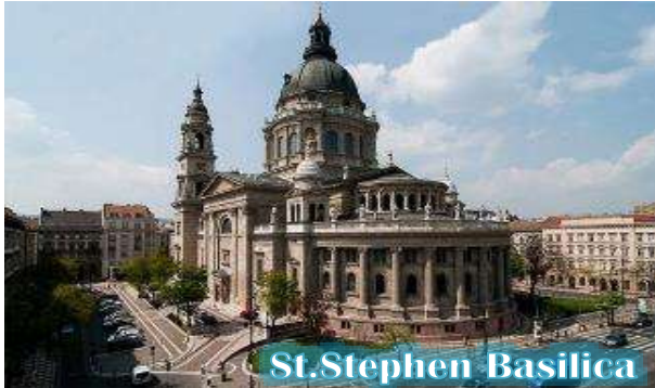
St. Stephen Basilica