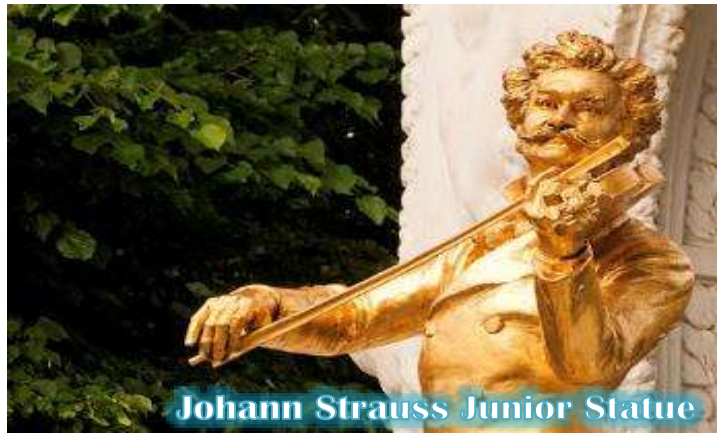
Johann Strauss Junior Statue

เช้า บริการอาหารเช้า ณ ห้องอาหารของโรงแรม นำท่านออกเดินทางเข้าสู่ใจกลาง “กรุงเวียนนา” (Vienna) ผ่าน “ถนนวงแหวน” Ring Strasse ซึ่งเป็นที่ตั้งของ โรง อوبرาการ (โอเปร่าเฮาส์), พระราชวังฮอฟบวร์ก, อาคารรัฐสภา, ศาลาว่าการ, มหาวิทยาลัยเวียนนา, โบสถ์ประจำเมือง, ศาลสูง ฯลฯ เดินทางสู่ “สวนสาธารณะสตัดท์ปาร์ค” สวนสาธารณะอันร่มรื่นใจกลางเมือง ชม “อนุสาวรีย์ โยฮันสตราสส์ จูเนียร์” Johann Strauss ศิลปินที่มีชื่อเสียงก้องโลก