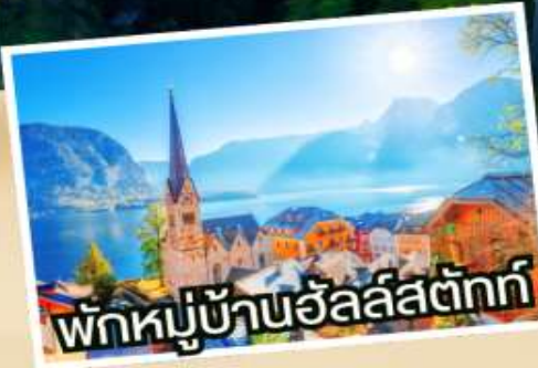
พักหมู่บ้านวัลส์ตัทท์