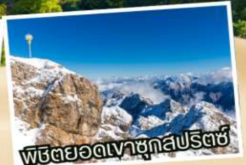
พิชิตยอดเขาชุกสปีตซ์