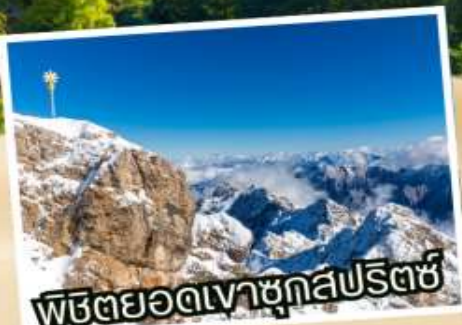
พิชิตยอดเขาชุกสปีตซ์