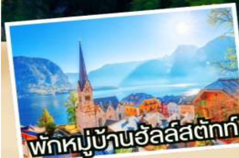
พักหมู่บ้านวัลส์ตัทท์