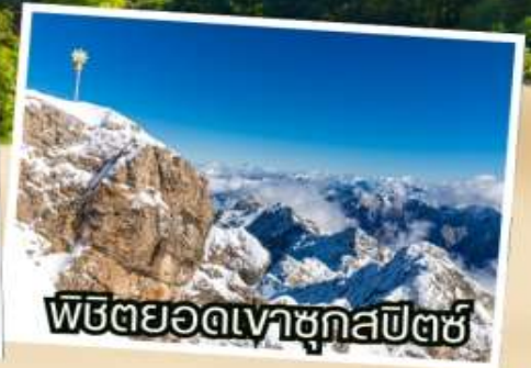
พิชิตยอดเขาชุกสปีตซ์