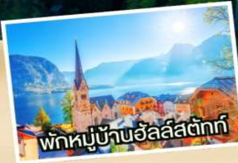
พักหมู่บ้านอัลส์ตัดท์