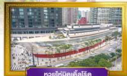
หอยไหมดเคิลไรด์