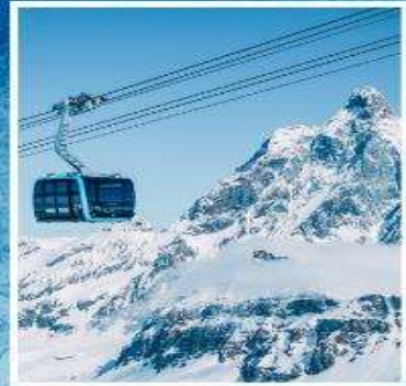
GLACIER PARADISE TOP OF ZERMATT