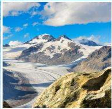
ALETCH GLACIER Riederalp, Bettmeralp