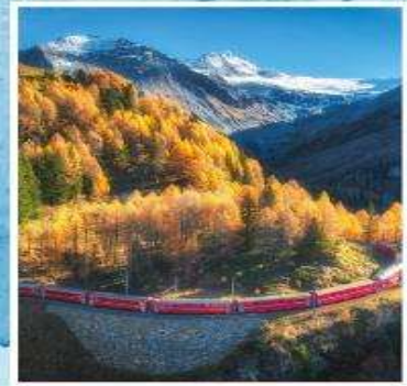
BERNINA EXPRESS Unesco