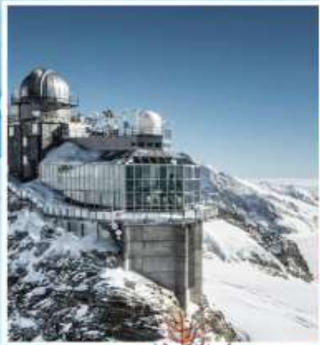
JUNGFRAUJOCH "Top of Europe"