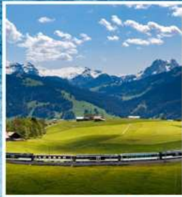
GOLDEN PASS LINE Montreux-Zweisimmen