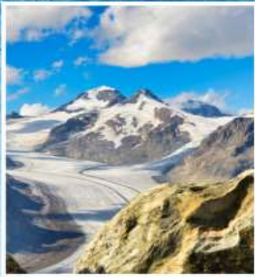
ALETCH GLACIER Riederalp, Bettmeralp

แกรนด์สวิตเซอร์แลนด์ 9 วัน QR พักหมู่บ้านเชอร์แมท(พ.ย./มี.ค.)