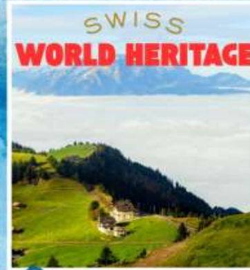
RIGI KULM Queen of the Mountains