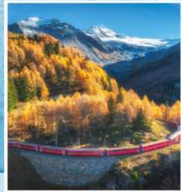
BERNINA EXPRESS Unesco World Heritage

ราคาพิเศษเริ่มต้นเพียง 119,900.- (รวมค่าวีซ่า)