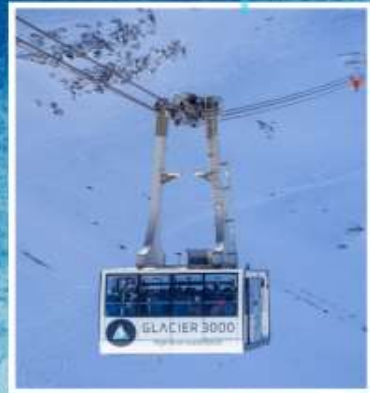
GLACIER3000 Peak walk by Tissot