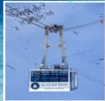
GLACIER3000 Peak walk by Tissot