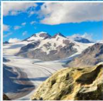
ALETCH GLACIER Riederalp, Bettmeralp

แกรนด์สวิตเซอร์แลนด์ 9 วัน QR พักหมู่บ้านเชอร์แมท(พ.ย./มี.ค.)