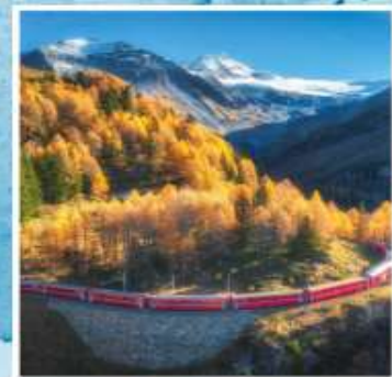
BERNINA EXPRESS Unesco World Heritage

ราคาพิเศษเริ่มต้นเพียง 119,900.- (รวมค่าวีซ่า)