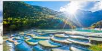
ทะเลสาบไป๋สุ่ยเหอ

*ทางบริษัทฯ ขอสงวนสิทธิ์ในการสลับโปรแกรมทัวร์ตามความเหมาะสมขึ้นอยู่กับสถานการณ์ปัจจุบัน โดยค่ามัดมือชั่งผลประโยชน์ของลูกค้าเป็นสำคัญ