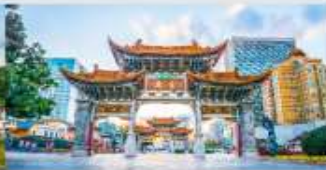
ประตูน้ำกวงโก๋หยก