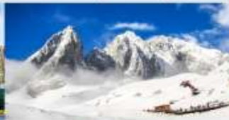
ภูเขาหิมะมิงกรหยก