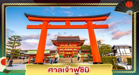
ศาลเจ้าฟูชิมิ