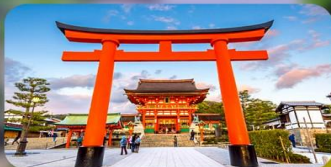
ศาลเจ้าฟูชิมิ