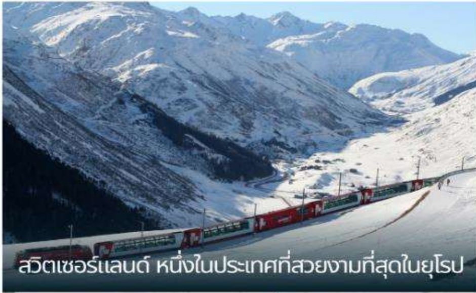
สวิตเซอร์แลนด์ หนึ่งในประเทศที่สวยงามที่สุดในยุโรป

เที่ยวชมสถานที่ท่องเที่ยวยังคง บรรยากาศดั้งเดิมของสวิตเซอร์แลนด์ อันสวยงาม (Unseen Switzerland) นั่งรถไฟและรถรางชมวิวกว้างที่มีชื่อเสียง ของสวิตเซอร์แลนด์ ถึงห้าขบวน