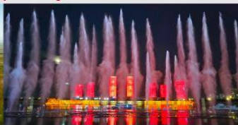
น้ำพุคังปาซือ