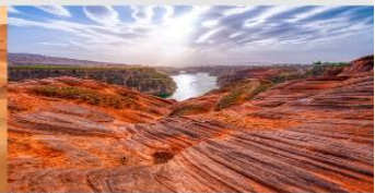
อุทยานหุบเขาคีลิน

*ทางบริษัทฯ ขอสงวนสิทธิ์ในการสลับโปรแกรมทัวร์ตามความเหมาะสมขึ้นอยู่กับสถานการณ์หน้างาน โดยคำนึงถึงผลประโยชน์ของลูกค้าเป็นสำคัญ