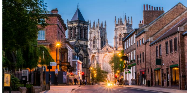
(Britannia Inferior) ชาวแองเกิลส์เข้ามาตั้งถิ่นฐานยอร์กก็