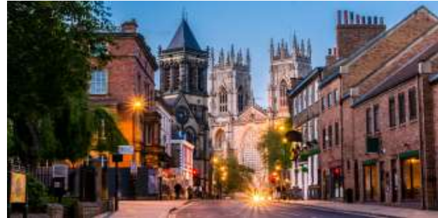
ชาวแองเกิลส์เข้ามาตั้งถิ่นฐานยอร์กก็