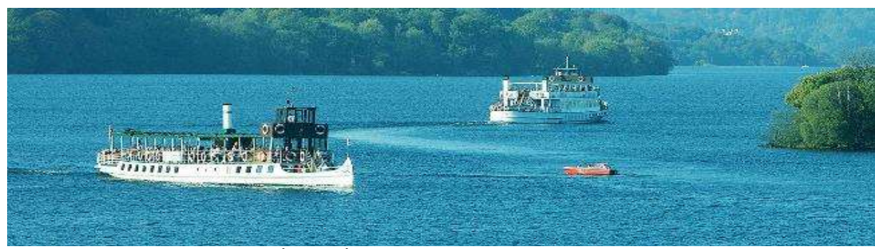
ด้วยต้นไม้ และดอกไม้เมืองหนาวที่แลดูร่มรื่นและสวยงาม ชมวิวสองข้างทางของทะเลสาบท่านจะได้ชม

บ่าย ออกเดินทางสู่เมืองวินเดอร์เมียร์ Windermere โดยใช้เส้นทางผ่านเขตแลคคิสทริก <<140 KM/ 1 ชั่วโมง 40 นาที >> ดินแดนแห่งทะเลสาบทั้ง 16 ในเขตคัมเบรีย(Cumbria) แห่งชมบรรยากาศของธรรมชาติรอบทะเลที่เต็มไปด้วย