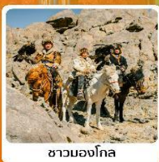
ชาวมองโกล