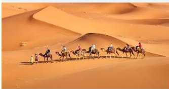
ชี้อูฐชมทะเลทราย