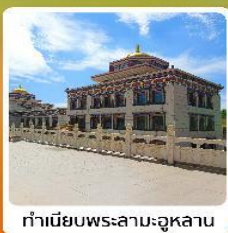
ทำเนียบพระลามะจุหลาน