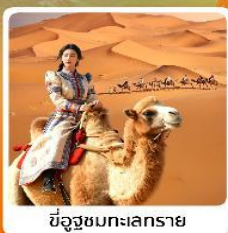
ซีอูซูชมทะเลทราย