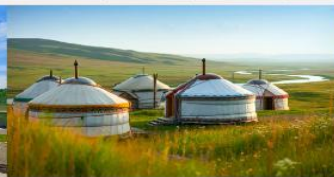
ทุ่งหญ้าออร์ดอส