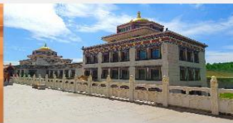
ทำเนียบพระลามะอุหลาน