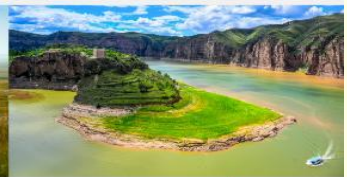
แกรนด์แคนยอนแม่น้ำเหลือง

*ทางบริษัทฯ ขอสงวนสิทธิ์ในการสลับโปรแกรมทัวร์ตามความเหมาะสมขึ้นอยู่กับสถานการณ์หน้างาน โดยคำนึงถึงผลประโยชน์ของลูกค้าเป็นสำคัญ