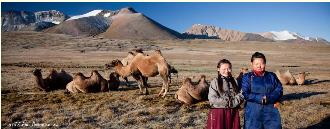
ภาพใช้เพื่อการโฆษณาเท่านั้น

นำท่านร่วมกิจกรรม พิธีต้อนรับแขกสไตล์มองโกล เป็นประเพณีโบราณที่มีมาช้านาน ชาวมองโกลมีอุปนิสัยที่รักเพื่อนฝูงและตรงไปตรงมาไม่เสแสร้ง เมื่อมีเพื่อนหรือแขกมาเยือนก็มักจะผูกมิตรอย่างจริงจัง และนำท่านร่วมกิจกรรม สวมใส่ชุดมองโกล สัมผัสพลังแห่งบรรพบุรุษ สวมเสื้อคลุมแบบดั้งเดิมที่มีสีสันสดใส ปักลวดลายอันประณีต คุณจะสัมผัสได้ถึงพลังแห่งบรรพบุรุษที่เคยปกครองดินแดนครึ่งโลก การสวมหมวกขนสัตว์ ผูกสายรัดเอว พร้อมเครื่องประดับเงินแท้ที่ส่องแสงระยิบระยับ จะทำให้ท่านเสมือนกลายเป็นนักรบแห่งทุ่งหญ้า พร้อมเครื่องประดับเงินแท้ที่ส่องแสงระยิบระยับ ของชนเผ่าที่เคยปกครองดินแดนครึ่งโลก เมื่อคุณยืนท่ามกลางทุ่งหญ้าไร้ขอบเขต