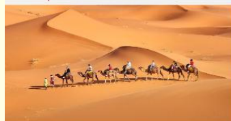
ชี้อูฐชมทะเลทราย