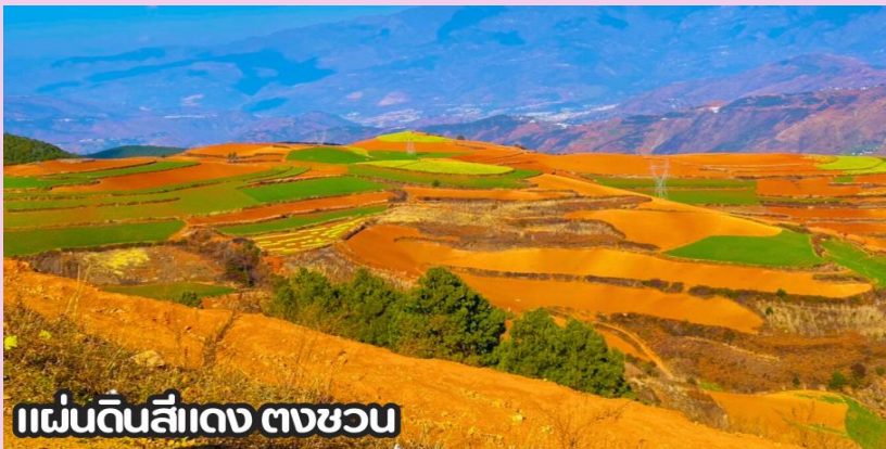
แผ่นดินสีแดง ตงชว่น

นำทุกท่านเดินทางสู่ เมืองตงชว่น (DONGCHUAN) หรือที่รู้จักกันในชื่อ หงถู่ตี้ ซึ่งแปลว่าแผ่นดินสีแดง เมืองตงชว่นตั้งอยู่ทางทิศตะวันออกเฉียงเหนือของมณฑลยูนหนาน มีภูมิประเทศเป็นทิวเขาสลับซับซ้อน ชาวพื้นเมืองส่วนใหญ่ประกอบอาชีพปลูกข้าวสาลี มันสำปะหลัง ผักต่างๆ และดอกไม้บานานาพันธุ์ และตงชว่น ยังถือว่าเป็นจุดท่องเที่ยวไฮไลต์อีกหนึ่งแห่งของคุนหมิง เป็นจุดที่นักท่องเที่ยวนิยมแวะมาเก็บภาพบรรยากาศที่สวยงาม นำท่านชม ภูเขาเจ็ดสีแห่งตงชว่น หรือ แผ่นดินสีแดง (DONGCHUAN RED LAND) ตั้งอยู่ในเขตเมืองตงชว่น ทางตอนเหนือของคุนหมิง มีภูมิประเทศเป็นทิวเขาสลับซับซ้อนและ