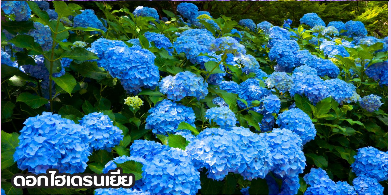
ดอกไฮเดรนเยีย

**หมายเหตุ: โปรแกรมชมดอกไม้ช่วงเดือน พ.ค. - ต.ค.2569 ในช่วง ณ วันเดินทางดังกล่าว หากดอกไม้ยังไม่บานหรืออาจจะร่วงหล่น..ทั้งนี้ขึ้นอยู่กับสภาพอากาศของแต่ละปี ทางบริษัทไม่การันตี และไม่สามารถกำหนดการบานของดอกไม้ได้ ทางบริษัทฯ ขอสงวนสิทธิ์ปรับเปลี่ยนรายการท่องเที่ยวอื่นทดแทนนะคะ รบกวนท่านโปรดทราบและทำความเข้าใจค่ะ**