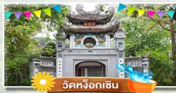
วัดหิ่งกเซิน