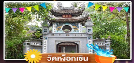
วัดหิ่งห่อเงิน