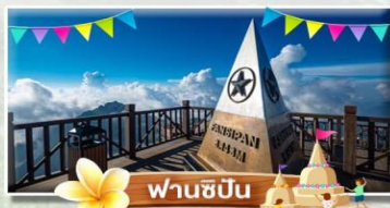
ฟานชีปัน