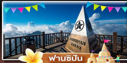
ฟานชีปัน