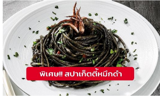
พิเศษ!! สปาเก็ตตี้หมึกดำ

Highlight! เมื่อเยือนเกาะเวนิส เมนูที่ขึ้นชื่อและหากได้มาต้องได้ลิ้มลอง สปาเก็ตตี้ผัดซอสหมึกดำที่คลุกเคล้ากับความหอมนุ่มนวลกับบรรยากาศ