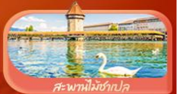
สะพานไม้ซำปก

Highlight เยือนหมู่บ้านแสนสวยเซอร์แมท เขิกอินศาลาไทยสุดงามที่โลซาน เที่ยวลูเซิร์น ชมสะพานไม้ซำปกและอนุสาวรีย์สิงโต ซาสิ แซปลิน ชมประติมากรรม The Fork และปราสาทซิลลองริมทะเลสาบ เยือนมิลาน มหาวิหารดูโอโม เกียรวอนิส เมืองลอยน้ำสุดโรแมนติก อินกับรักอมตะที่บ้านจูเลียต และช้อปปิ้งจุใจที่ Serravalle Outlet