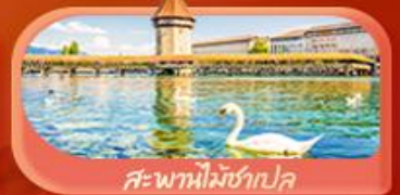
สะพานไม้ซำปก

Highlight เยือนหมู่บ้านแสนสวยเซอร์แมท เช็กอินศาลาไทยสุดงามที่โลซาน เที่ยวลูเซิร์น ชมสะพานไม้ซำปกและอนุสาวรีย์สิงโต ซาสิ แซปลิน ชมประติมากรรม The Fork และปราสาทซิลลองริมทะเลสาบ เยือนมิลาน มหาวิหารดูโอโม เที้ยวเวนิส เมืองลอยน้ำสุดโรแมนติก อินกับรักอมตะที่บ้านลูเวียต และช้อปปิ้งจุใจที่ Serravalle Outlet