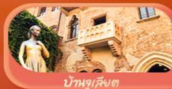
บ้านลูเวียต