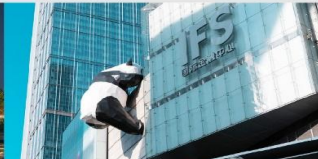
แพนด้ายักษ์ปิ่นตึก IFS

*ทางบริษัทฯ ขอสงวนสิทธิ์ในการสลับโปรแกรมทัวร์ตามความเหมาะสมขึ้นอยู่กับสถานการณ์หน้างาน โดยคำนึงถึงผลประโยชน์ของลูกค้าเป็นสำคัญ