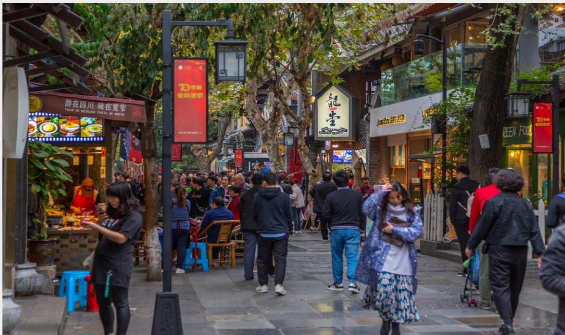
เย็น อิสระอาหารเย็นตามอัธยาศัย ณ ซอยกว้างซอยแคบ

บ่าย นำท่านสู่ ร้านหมอนไอโซน สีนค้ำหมอนและตีนนอนยางพาราที่ผ่านกระบวนการผลิตที่มีคุณภาพ จากนั้นนำท่านสู่ ซอยกว้างซอยแคบ หรือ “ถนนควานจ้าย (Kuanxianzi Alley)” เป็นถนนที่แสดงถึงเสน่ห์ของวิถีชีวิตการเป็นอยู่ของคนจีนเฉิงตูในสมัยโบราณ ที่มีการผสมความเป็นทันสมัยเข้าไปอย่างลงตัว ถนนคนเดินมี 3 ซอย แต่ละซอยมีความยาวประมาณ 400 เมตร มีร้านค้าเล็กๆ ในแต่ละซอยให้ท่านได้อิสระเดินช้อปปิ้งตามอัธยาศัย