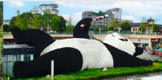
รูปปั้นหมีแพนด้าอนเซลฟ์