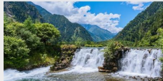
อุทยานแห่งชาติปี่เฟิงโกว