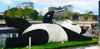
รูปปั้นหมีแพนด้าอนเซลฟ์