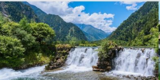
อุทยานแห่งชาติปี่เฟิงโกว