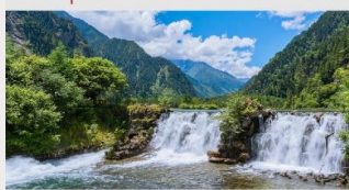
อุทยานแห่งชาติปี่เฟิงโกว