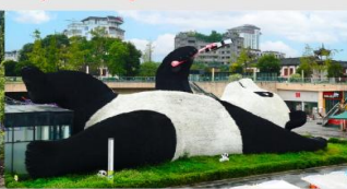
รูปปั้นหมีแพนด้าอนเซลฟ์