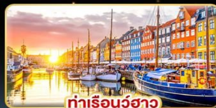
ท่าเรือบูร์ฮา