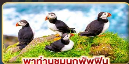
พาท่านชมนกพิพฟิน