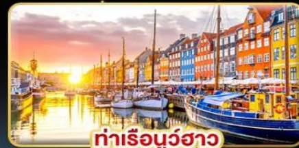
ท่าเรือบูร์ฮาว