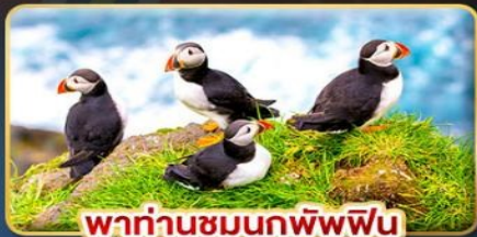
พาท่านชมนกพิพฟิน