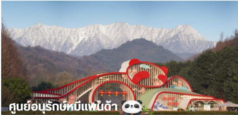
ศูนย์อนุรักษ์หมีแพนต้า