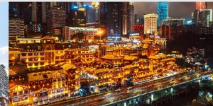
หงหยาดัง(ตอนกลางคืน)

*ทางบริษัทฯ ขอสงวนสิทธิ์ในการสลับโปรแกรมทัวร์ตามความเหมาะสมขึ้นอยู่กับสถานการณ์หน้างาน โดยคำนึงถึงผลประโยชน์ของลูกค้าเป็นสำคัญ