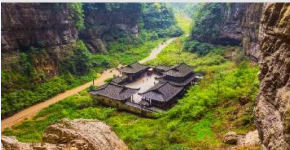
อุทยานหลุมฟ้าสะพานสวรรค์