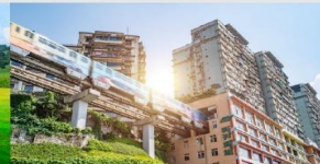
รถไฟฟ้าทะลุตีต