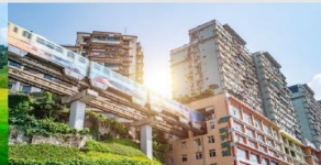
รถไฟฟ้าทะลุตีต