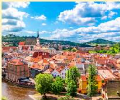
เชสกี คลุมลอฟ Cesky Krumlov เมืองมรดกโลก เป็นเมืองขนาดเล็กในภูมิภาคโบฮีเมียใต้ของสาธารณรัฐเช็กมีชื่อเสียงจากสถาปัตยกรรมและศิลปะของเขตเมืองเก่าและปราสาทครุมลอฟซึ่งเขตเมืองเก่านี้ได้รับการขึ้นทะเบียนจากยูเนสโกให้เป็นมรดกโลก