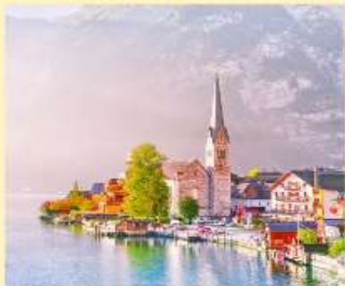
หมู่บ้านฮัลล์สตัดท์ Hallstatt หมู่บ้านนารีกรรมฝั่งทะเลสาบฮัลล์สตัดท์ นำท่านชมเมืองฮัลล์สตัดท์ เมืองที่ตั้งอยู่ใจกลางดินแดนแห่งเทพนิยาย ซาสส์กิมแมร์รุกท ดูดังพลอยเม็ดงามประดับอยู่เชิงเขา ดัคชไตน์