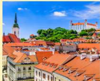
กรุงบราติสลาวา Bratislava เมืองหลวงและเมืองที่ใหญ่ที่สุดของประเทศสโลวาครวมทั้งเป็นเมืองที่มีประชากรหนาแน่นที่สุดในภูมิภาคยุโรปกลาง กรุงบราติสลาวาตั้งอยู่บนสองฝั่งแม่น้ำดานูบที่บริเวณพรมแดนของสโลวาเกียกับออสเตรียและฮังการี ใกล้กับพรมแดนสาธารณรัฐเช็ก