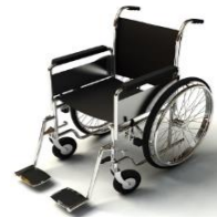
การรับบริการดูแลเป็นพิเศษ

กรณีผู้เดินทางต้องการความช่วยเหลือเป็นพิเศษ อาทิเช่น การใช้วีลแชร์ กรุณาแจ้งบริษัทฯ อย่างน้อย 7 วันก่อนการเดินทาง มิฉะนั้นบริษัทฯ จะไม่สามารถจัดการล่วงหน้าได้ เนื่องจากการขอใช้วีลแชร์ในสนามบินนั้น ต้องมีขั้นตอนในการขอล่วงหน้า และบางสายการบินอาจมีการเรียกเก็บค่าใช้จ่ายทั้งทางสนามบินในไทยและในต่างประเทศ ซึ่งผู้เดินทางสามารถสอบถามกับเจ้าหน้าที่ได้โดยตรงก่อนทำการจอง และหากในขณะของท่านมีผู้ต้องการดูแลพิเศษ เช่น ผู้ที่นั่งรถเข็น (Wheelchair) , เด็ก , ผู้สูงอายุและผู้ที่มีโรคประจำตัวหรือไม่สะดวกในการเดินทางท่องเที่ยวในระยะเวลาเกินกว่า 4 - 5 ชั่วโมงติดต่อกัน ท่านและครอบครัวต้องให้การดูแลสมาชิกภายในครอบครัวของท่านเอง เนื่องจากการเดินทางเป็นหมู่คณะ หัวหน้าทัวร์มีความจำเป็นต้องดูแลคณะทัวร์ทั้งหมด