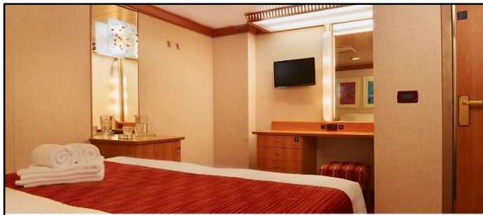
ห้องไม่มีหน้าต่าง (Inside Cabin)