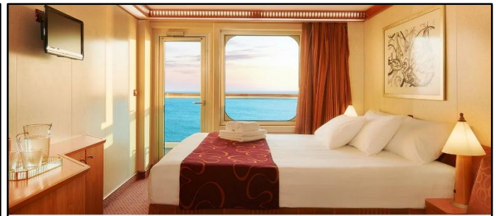
ห้องมีระเบียง (Balcony Cabin)