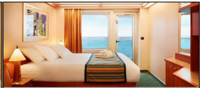
ห้องมีระเบียง (Balcony Cabin)