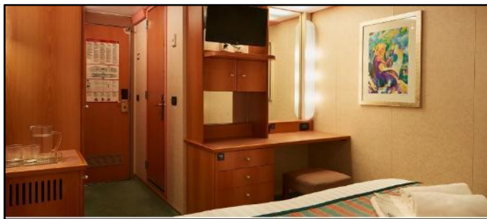
ห้องไม่มีหน้าต่าง (Inside Cabin)