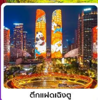
ตึกแฝดเฉิงตู