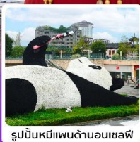
รูปปั้นหมีแพนด้านอนเซลฟี